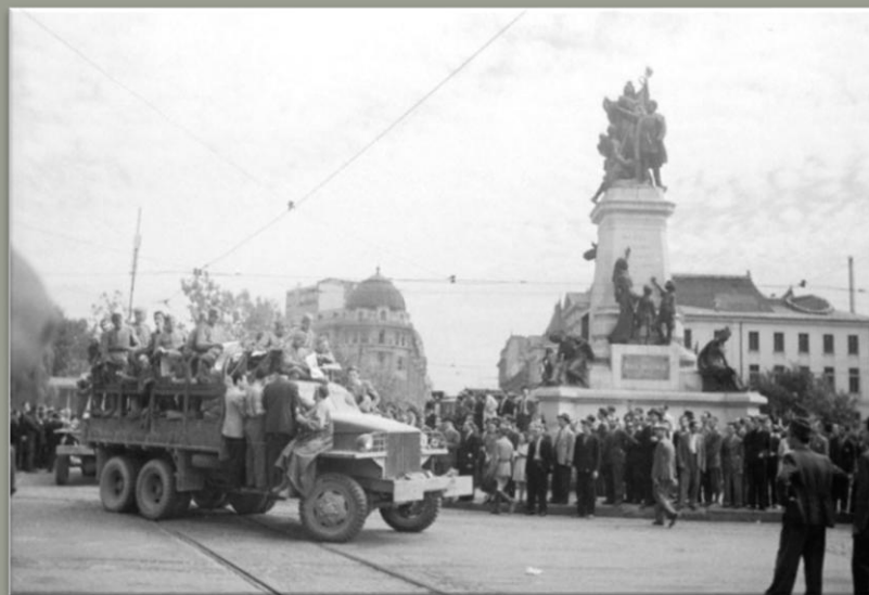
Освобождение Бухареста 31 августа 1944 года

Прабабушка осталась одна с тремя детьми и продолжила работу на кожевенном заводе. Это были трудные годы. Работать приходилось по 12 часов в день. По воспоминаниям деда они всегда испытывали хронический голод – продовольствия было очень мало. На день прабабушка оставляла им миску молока и полбуханки хлеба на всех троих. Чтобы хоть как-то утолить голод, дети из рогаток стреляли воробьев и жарили их прямо на костре.