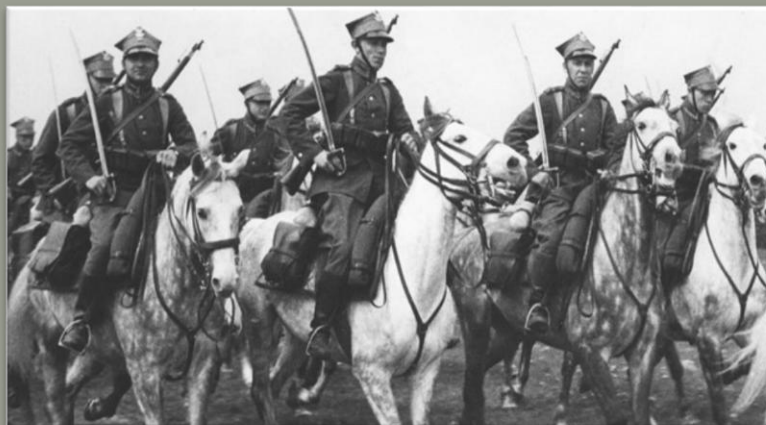
Кавалерия Войска Польского, 1939 год.