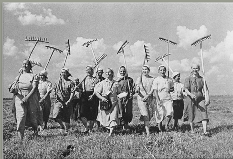
Крестьяне 40-х годов XIX века