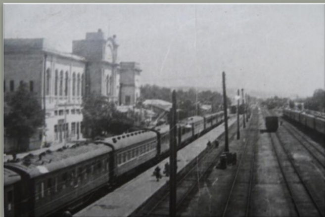
1942 год. Прибытие поезда с эвакуированными гражданами из прифронтовой полосы в г. Сталинабад.

В годы войны в Сталинабаде нашли приют и польские граждане, особенно – маленькие жители Польши, оставшиеся без родителей. Для них был создан специальный детский дом.