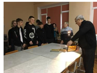
В учебной лаборатории по оптике