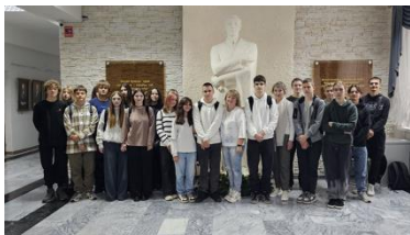
Музей истории ГрГУ