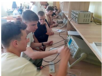
Мастер-класс по электронике