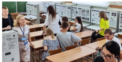
В учебной лаборатории по энергетике