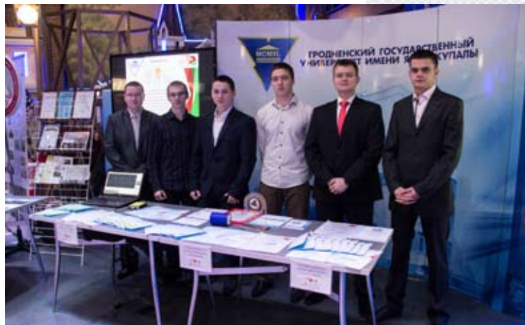
▲ Будущие новаторы – студенты Гродненского государственного университета имени Янки Купалы

Подобное оборудование Беларусь пока закупает за рубежом. Между тем стоимость зарубежных экземпляров колоссальная. Не удивительно, ведь с помощью такой компактной современной лаборатории можно проводить те же учебные эксперименты по апробации